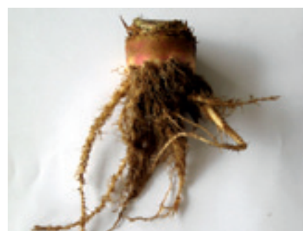
Foto 7, 8 en 9. Het wortelstelsel vertelt een heel verhaal. Links vertakkingen als gevolg van een slechte bodemstructuur. In het midden het afsterven van de zijwortels door een te lage pH. Rechts vertakkingen en vorming van haarwortels door aantasting van het gele bietencysteaaltje.