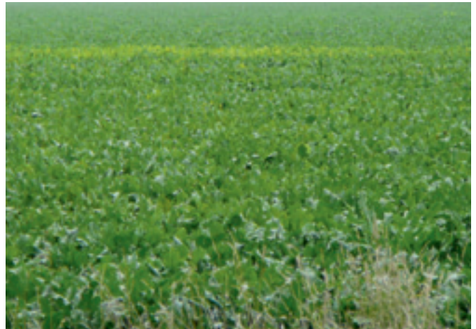
Foto 1 en 2. Links een plek met vergelingsziekte. Rechts een opvallende, scherp afgebakende plek met blinkers (rhizomanie).