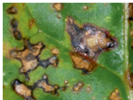
Foto 10 en 11. Gemakkelijk te verwarren: bladvlekken veroorzaakt door cercospora (links) en door pseudomonas (rechts).