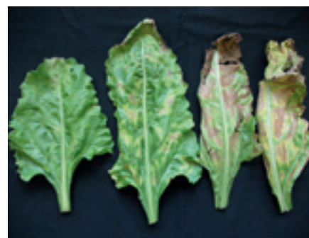
Foto 3, 4 en 5. Gele symptomen die gemakkelijk zijn te verwarren. Links een blad met magnesiumgebrek. Dit uit zich in geelverkleuring tussen de nerven, beginnend aan de top van het blad. Later kan er op de top van het blad een zwarte rand ontstaan. Midden, mangaangebrek: wolkerige gele vlekken tussen de nerven in het blad. Rechts, verticillium: geelverkleuring tussen de nerven met in een later stadium afsterving (verbruining) van de vergeelde stukken blad. Symptomen treden vaak eerst op de helft van het blad op.

bodemstructuur kunnen de mate van aantasting van diverse ziekten en plagen veel erger maken. Het wortelstelsel van de biet geeft al vaak een signaal van de oorzaak af. Spit de biet hiervoor uit met een schepje of schop en klop voorzichtig de grond van de wortels en bekijk ze goed, eventueel met een loep (foto's 7 t/m 9). Zit er nog te veel grond aan, spoel de wortels dan voorzichtig onder de kraan af en leg ze in een bakje water.